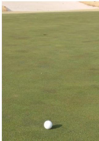
同じ場所から見え方の違いです