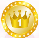
友善Proチーム ( - 9 )