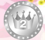
小池Proチーム ( - 11 )