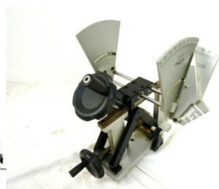
ロフト角ライ角測定器