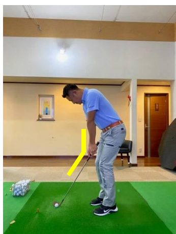
手首の角度をキープしたまま